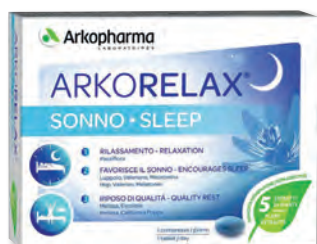
ARKORELAX SONNO Contribuisce a migliorare tutte le fasi del sonno