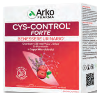
CYS CONTROL FORTE Per favorire il comfort urinario preservando l'equilibrio del microbiota