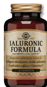
LINEA SOLGAR Integratori alimentari a base di vitamine, minerali, amminoacidi, nutraceutici, probiotici ed estratti vegetali