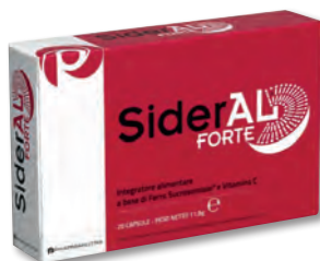
SIDERAL FORTE Ideale per colmare carenze nutrizionali e supportare funzioni cognitive, metabolismo energetico e difese immunitarie