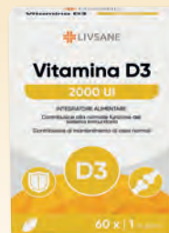
LIVSANE VITAMINA D3 Integratore alimentare per il benessere di ossa, denti e funzione muscolare