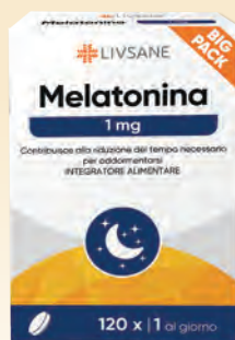
LIVSANE MELATONINA Contribuisce alla riduzione del tempo necessario per addormentarsi