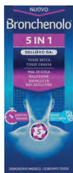
BRONCHENOLO 5 IN 1 Dispositivo Medico CE