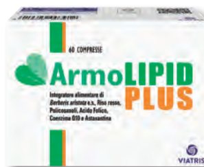
ARMOLIPID PLUS Per la regolare funzionalità dell'apparato cardiovascolare