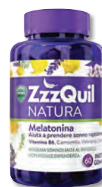
VICKS ZZZQUIL NATURA Utile per chi ha difficoltà ad addormentarsi