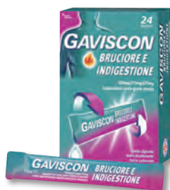
GAVISCON BRUCIORE E INDIGESTIONE